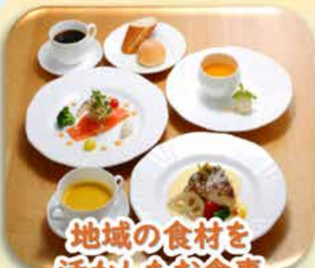
地域の食材を 活かしたお食事