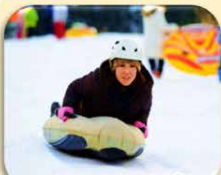
スノースライダー

自然学校ならではのアクティビティをとおして、 自然・地域との「共生」を学べる施設