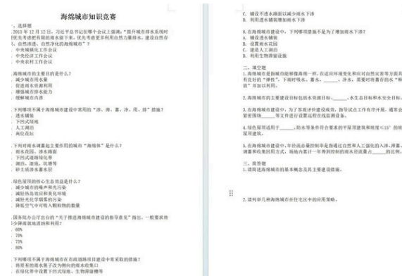
(スポンジシティ知識コンペティションの質問の写真)

知識コンペティションが開催され、スポンジシティの建設と防災に重点を置いた質問が出される。グループによるクイズ形式が採用され、得点で順位が付けられ、入賞者には賞品が授与される。この活動の後にはまとめと共有のセッションが開かれ、そこで生徒たちは何を学んだかを話し合い、学習体験を共有し、都市の浸水管理と防災にどうすればより良い形で参画できるかを探ることができる。