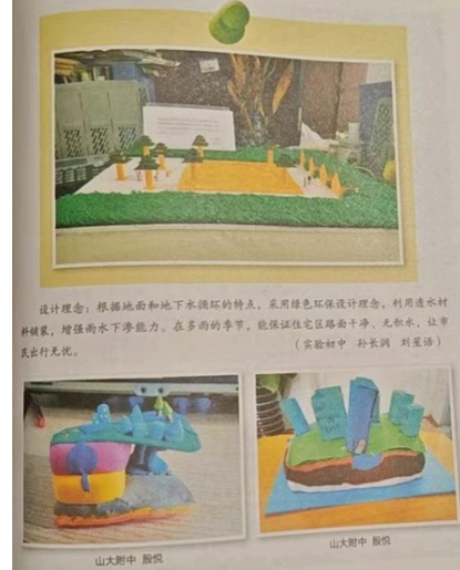
(生徒が作成したスポンジシティの模型の写真)