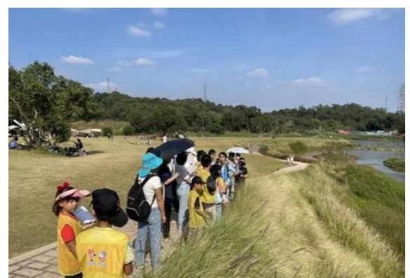
(生徒たちは、スポンジシティの建設について現地体験学習を行った)